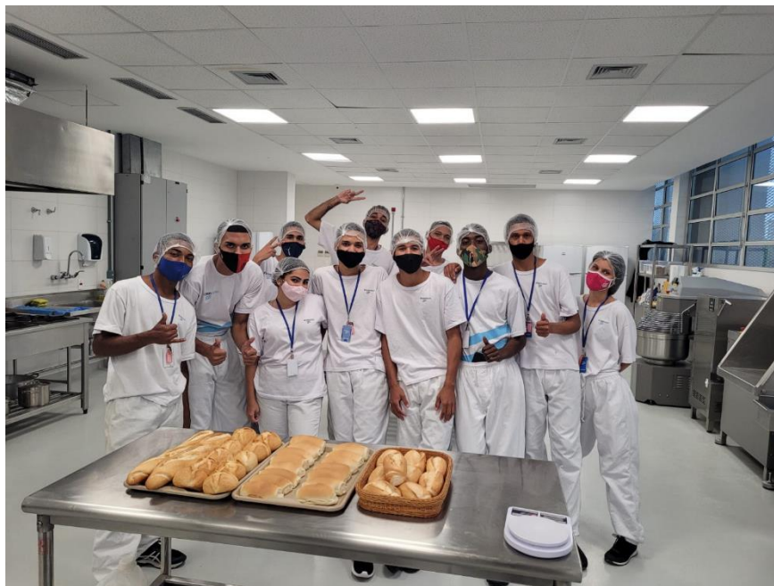
Turma do curso de Padeiro e Confeiteiro no SENAI Tijuca