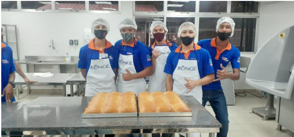
Turma do curso de Padeiro e Confeiteiro no SENAI Nova Iguaçu