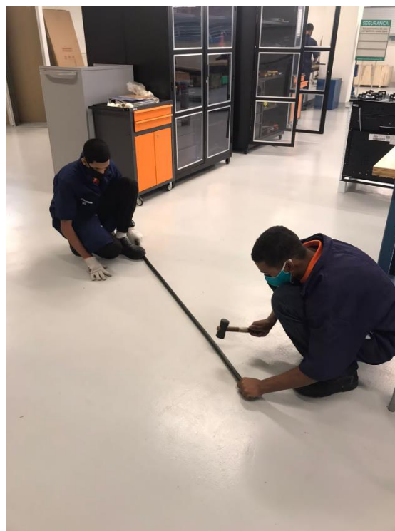
Aula no curso de Instalador Hidráulico no SENAI Tijuca

Durante o período realizamos o acompanhamento dos adolescentes que estavam inseridos no programa, auxiliando-os em suas dificuldades que iam desde ausência de internet para acompanhamento das aulas da instituição formadora, que passaram a ser remotas, bem como dificuldade em acompanhar o conteúdo apresentado. As parcerias com as instituições e empresas, foram extremamente importantes neste momento.