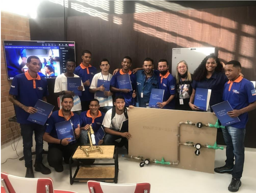
*Apresentação do Trabalho Final Turma Instalador Hidráulico – Unidade Tijuca