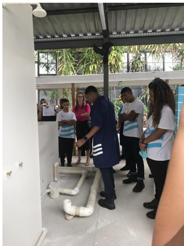
*Apresentação do Trabalho Final Turma Instalador Hidráulico – Unidade Niterói

Entretanto, não foi possível a formação de turmas no SENAI apenas com o número de jovens em medidas restritivas de liberdade contratados. Assim, foi necessária, em 2022, a realização de turmas mistas (jovens em medidas restritivas de liberdade/ jovens em cumprimento de medidas em meio aberto/ jovens de medidas protetivas / jovens oriundos da rede pública de ensino).