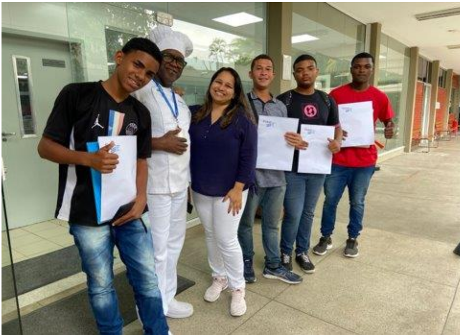
*Entrega de Certificados. Alunos Turma Padeiro e Confeiteiro – Unidade Nova Iguaçu