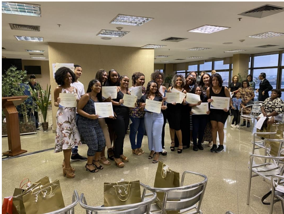
*Formatura dos jovens que concluíram o curso de Embelezamento do Olhar