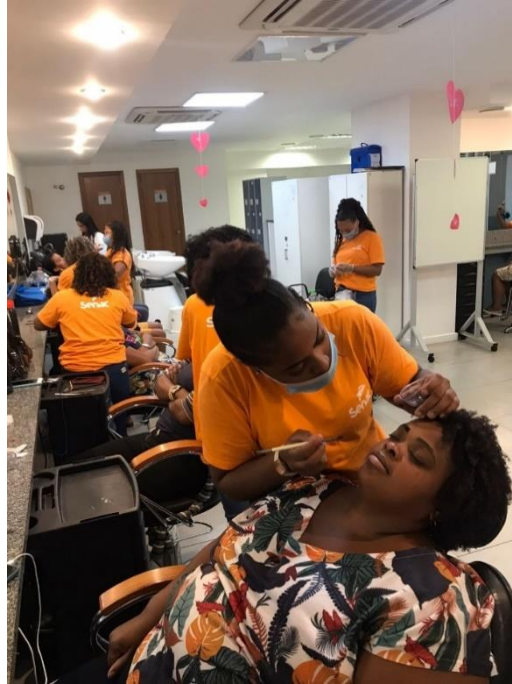
*Aula prática do curso Embelezamento do Olhar