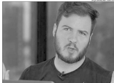
Com mais de 5 mi inscritos em seu canal, Thiago Nigro é um dos palestrantes