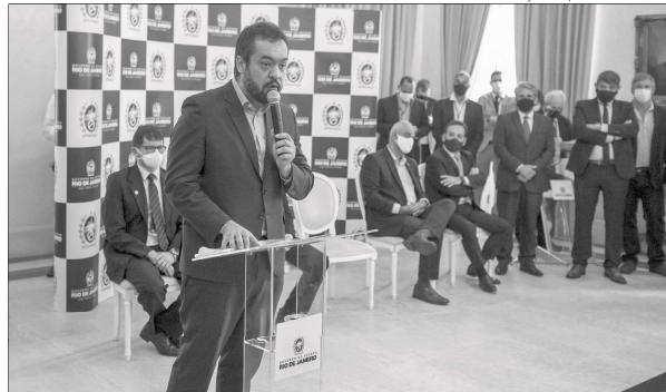
Governador Cláudio Castro lançou o programa durante o Fórum dos Secretários Municipais de Agricultura

"Estamos em um processo de reconstrução do estado, e o agricultor é um dos atores importantes, que não ficará em segundo plano. Para termos um Rio de Janeiro forte, precisamos de um interior forte. O