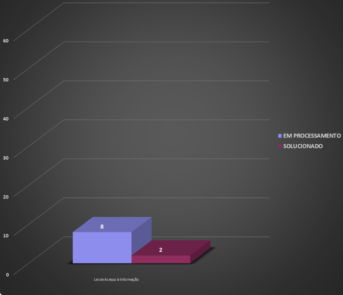
Gráfico Detalhado - Tipo de Manifestação x Situação